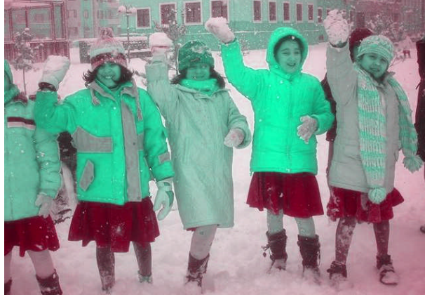
Resim 1.6: Bireyler mevsimlere uygun giyinmelidirler.

Satıcılara, konuşmacılara, politikacılara insanların aklında kalmaları için üzerlerine farklı bir aksesuar bulundurmaları tavsiye edilir. Örneğın, Süleyman Demirel'in şapkası onu diđer liderlerden ayıran bir semboldür. Tansu Çiller'in fuları, Bülent Ecevit'in mavi gömleđi de ayırt edici sembollerdir.