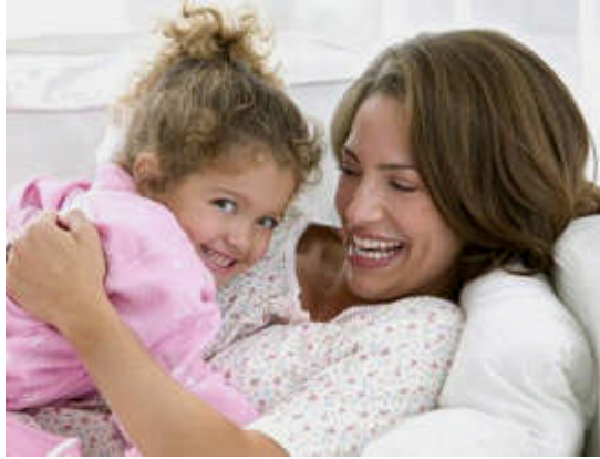
Resim2.13: Hayatın her döneminde anne hep fedakârdır.

Fedakârlık, insan ilişkilerinde önemlidir. İnsanların zaman zaman bazı konularda fedakârlık yaparak karşısındaki kişiye verdiği değeri göstermesi bireyi mutlu eder. “Arkadaşım beni seviyor, annem bana değer veriyor, benim için bunu yapar.” diye düşünmesi güven duygusunu geliştirir. Sözlükte fedakâr, kendini, çıkarını, zamanını ya da başka bir şeyini feda etmekten çekinmeyen, özverili kişidir.