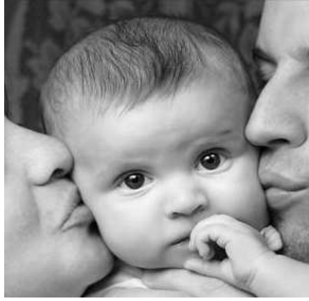
Resim 2.9: Anne ve baba sevgisi her şeyden önemlidir.

Sevgi insan hayatı için çok önemlidir. Gebeliğin başından itibaren annenin bebeğini kabul etmesi, sevmesi onun tüm hayatını etkiler. Sevildiğini bilen çocuğun kendine güveni vardır, insan ilişkileri sağlıklı ve mutludur. Sevgi de dokunmanın da önemi büyüktür. Doktorların denetiminde olan bir yetimhanede çok sayıda bebeğin büyümeden öldüğü yönetimin dikkatini çekmiştir. Gıdaları ve temizlik koşulları kırsal kesimlerde yaşayan çocuklardan daha iyi olduğu halde, yetimhanedeki bebekler, yetersiz gıda alan ve pis koşullarda yetişen çocuklardan daha fazla hastalığa yakalanıyor ve ölüyorlardı.