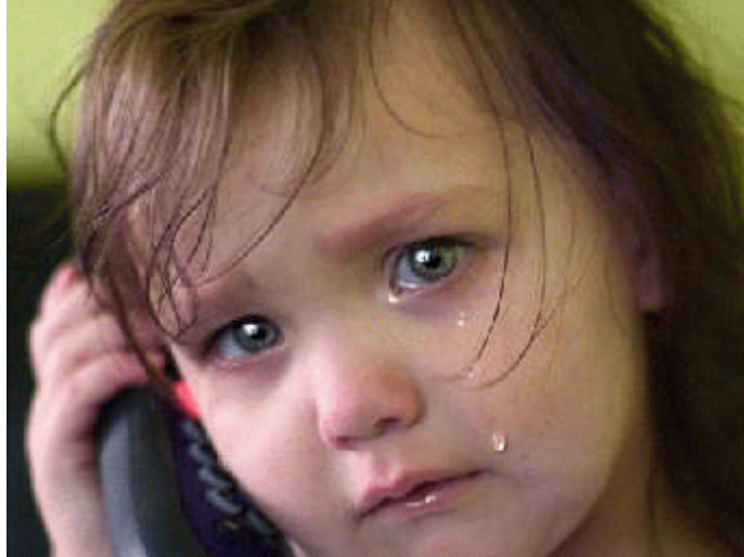
Resim 2.14: İletişim araçları yaşamı kolaylaştırır.

1980 yılında bu konuda Kanada'da yapılan araştırmanın sonucu şöyledir. Bu araştırma Kanada'da birbirine çok yakın iki kasabada yapılmıştır. Bu kasabalar ırksal ve toplumsal sınıf açısından büyük benzerliklere sahiptir ve birinde televizyon varken diğerinde yoktur.