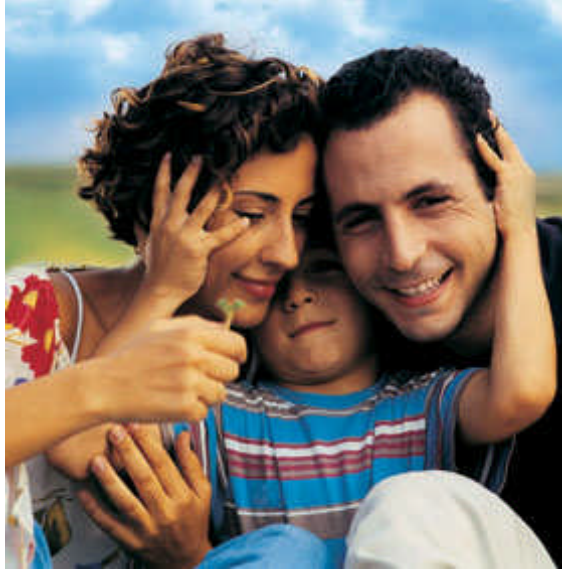
Resim 2.12:Çocuk sevgi ister, hoşgörü ister.

Çocukluktan başlayarak bireyin yaptığı her davranışta hata bulmak, yaptığı küçük hatalardan dolayı sürekli eleştirmek bireyi mutsuz yapar. Yeterince mutlu olmayan birey, çevresiyle sağlıklı iletişim kuramaz. Kendine güvenmeyen birey, başkalarına da güvenmez. Takdir edilmemiş, onaylanmamış ve cezalandırılmış birey herhangi bir ortamda pasif ve ürkek davranır, diğer insanlarla paylaşım oluşturamaz.