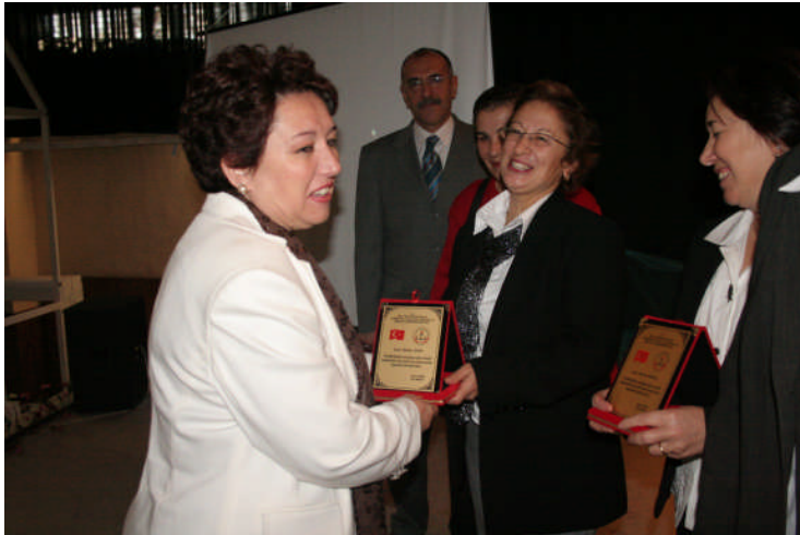
Resim 2.4: Başarılar, yönetici tarafından ödüllendirilmelidir.

Böyle davranan bir yönetici ast-üst ilişkilerini dengeler, başarılı iletişimin yaratıcısı olabilir.