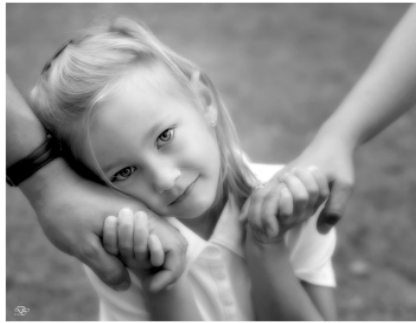
Resim 1.13: Aile yaşantısı çocuklar için önemlidir

Popüler kültür yolu ile geçmişi yeniden yorumluyor, şimdiki zamanı değerlendiriyor ve gelecek hakkında fikir veriyor. 1950’lerde yapılmış II. Dünya Savaşı’na ilişkin bir film insanları o yılların zor günlerine ve savaşın acımazlığına götürebilmektedir.