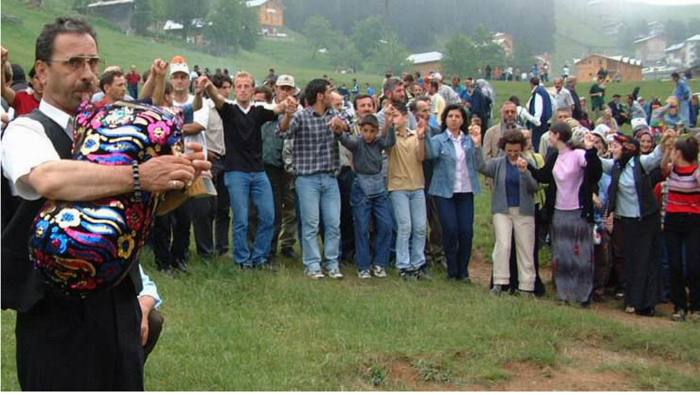
Resim 1.9: Gelenek ve görenekler insan ilişkilerini etkiler.

Sözcük anlamı olarak gelenek, eski çağlardan beri yerleşmiş olup kuşaktan kuşağa geçerek gelen ve toplumun üyeleri arasında ortak bir ruh, dolayısıyla sağlam bir bağ oluşturan her türlü alışkanlıklardır. Gelenekle ilgili yapılan tanımların ortak özellikleri, geleneğin geçmişten günümüze gelmesi, toplum üyelerini birbirine bağlaması ve genç kuşaklara birtakım manevi değer ve alışkanlıklar aktarmasıdır.