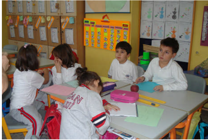
Resim 1.3: Birey, görgü kurallarını erken çocukluk döneminde öğrenmelidir.

Toplumsal kurumları oluşturan kurallardan biri de görgü kurallarıdır. Belirli bir zaman süresinde alışlagelmiş ve kişilerde yapılması veya yapılmaması gerektiği yolunda yaygın bir fikrin olduğu davranış biçimleri görgü kuralları olarak tanımlanabilir. Örneğin, yüksek sesle konuşmamak bir görgü kuralıdır. Görgü kurallarına uymayan kişiler toplumda görgüsüz, kaba, nezaketsiz olarak adlandırılır. Fakat görgü kurallarına uymamak suç değildir.