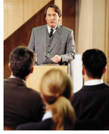
Resim 1.5: İyi bir hitap için önceden hazırlanmalıdır.

Toplumsal ilişkilerde birey, hitap etmeleri gereken kişilerin buldukları yer ve makama göre farklı hitap şekilleri kullanır.