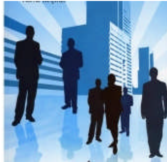
Resim 2.2: İş hayatında iletişim önemlidir

İş hayatında, organizasyonlar yalın, yönetim kademeleri azaltılmış olmalıdır. Böylelikle iletişim hızlanır ve iletişimin kalitesi artar. İş hayatında unutulmaması gereken önemli bir konu da tüm çalışanların çalıştıkları kurumda söz sahibi olması gerekliliğidir. Kurumun on yıl sonraki hedeflerini bilmeye hakkı vardır. Çalışanları önce bu konuda devamlı iletişimle bilgilendirmek ve onları hedefe yönlendirmek çok önemlidir.