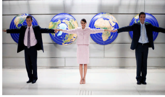
Resim 2.1: İy bir iletişim, iş yerinin başarısını artırır

Bu dört psikolojik tip, her toplumda ve her kuruluştaki bütünü oluşturur ve bu tiplerin hepsine ihtiyaç vardır. Bu farklı tipteki insanların dengeli bir şekilde ve zamanında motive edilerek potansiyellerinin en üst düzeyde ortaya çıkartılması ise başarılı yönetim ve iyi bir iletişimle mümkündür.