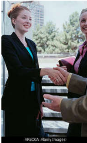
Resim 1.1: İki insanın birbirini fark etmesi ile iletişim başlar.

İki insanın birbirini fark etmesiyle iletişim başlar. İletişim hem kişisel hem de toplumsal bir süreçtir. İletişim, psikososyal bir süreçtir. Bir kişinin kendinden hoşlanması ve kendini diğer insanlarla, doğayla ilişki içinde görmesi, yaşamın anlamlı olmasını sağlar. Bilinçli iletişim, anlamlı yaşama, anlamlı yaşam da sakin ruh hâlinin gelişmesine yol açar.