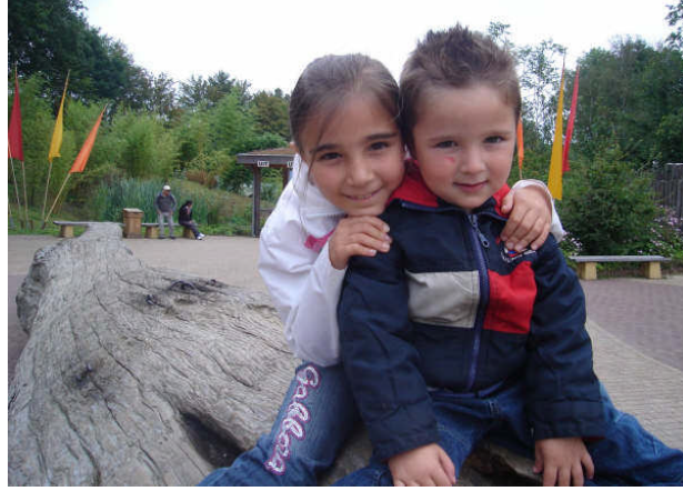
Resim 2.7: Kişilerin etkileşiminde sevgi çok önemlidir

Ne yazık ki hemen hiç dikkatimizi çekmiyor ama bizler birbirimize giderek daha az “dokunuyor” ve sürekli aramıza mesafe koyuyoruz.