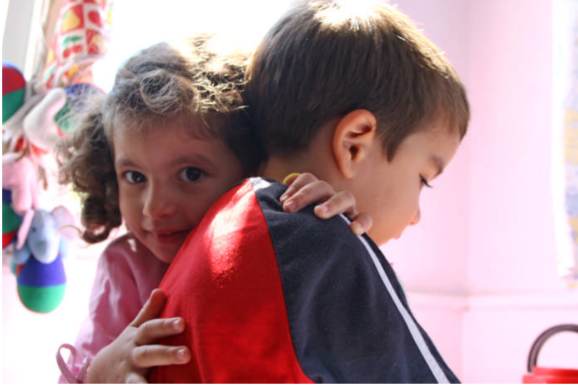
Resim 2.10: Küçük bir gülüş, dokunuş, bakış sevgiyi göstermek için önemlidir.

Sevgi anne-baba çocuk ilişkisinde ne kadar önemliyse, eşler arasında da o denli önemlidir. Eşe verilen bir çiçek, güzel bir söz evlilikte sağlıklı ilişkiler içinde önemlidir.