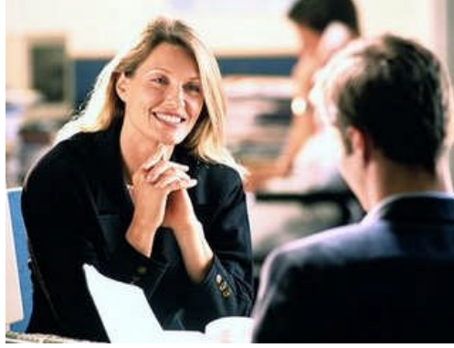
Resim 2.8: Kişilerin etkileşiminde iyi niyet çok önemlidir

İyi niyet her zaman da iyi sonuçlar doğurmaz. Doğru zamanda doğru davranışı sergilemek gerekir. İnsan bu doğruyu bilse de o doğruyu bulmakta zorlanabilir. İnsan bazen karşısındakine fayda sağlamak için çabalar gibi gözükse de aslında kendi canı yanmasın diye uğraşır ve bunu sanki bir refleks gibi yapar. Kendine bile karşısındakinin iyiliği için uğraştığını telkin eder.