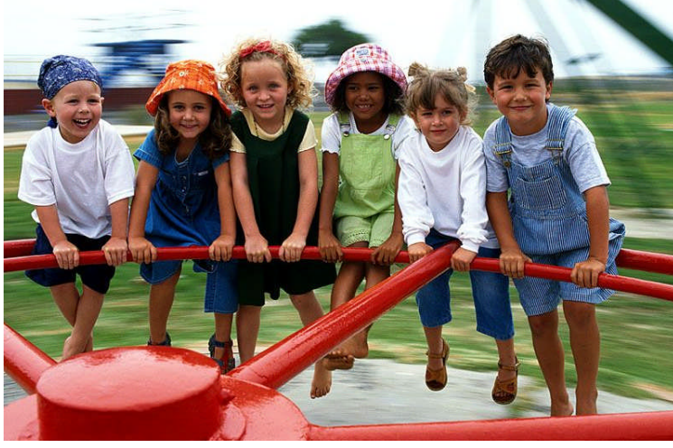
Resim 2.11: Çocuklar oyun oynarken birbirlerine saygı gösterirler.

Her insan saygı görmek, değer verilmek ister. Bunun için öncelikle kendisine ve çevresindekilere değer vermeyi öğrenmeli, başkalarına karşı saygılı olmalıdır. Yoksa aradığı saygıyı bulamaz. Hasan Yılmaz “Öğretmenim Lütfen Bu Kitabı Okur musun?” adlı kitabında kısaca şöyle bir hikâye anlatır: