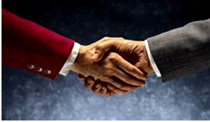
Resim 1.4: El sıkma dostluğun, samimiyetin ifadesidir

Her ülkenin farklı selamlaşma şekilleri vardır. Türkler el sıkışıp yanaklardan öperken Ruslar, Afrika'da yaşayan yerliler farklı selamlaşırlar. Selamlaşma da kültürden etkilenir.