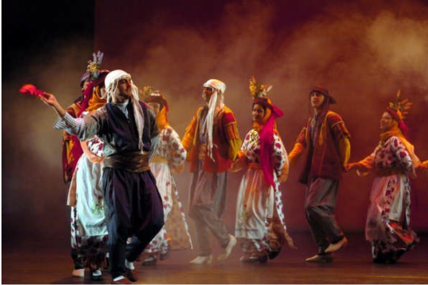
Resim 1.12: Folklor kültürümüzün ayrılmaz parçasıdır.

Kültür insanların toplumsal mirasıdır. Kültürün yaratılışı ve aktarılışı insanın özel bir becerisi olan sembollere dayanır. Bu sembollerin en önemlisi o ülkede konuşulan dildir. İnsanların temel iletişim biçimlerinden olan, işaret ve mimiklerden oluşan vücut dili bile sembollerden oluşur.