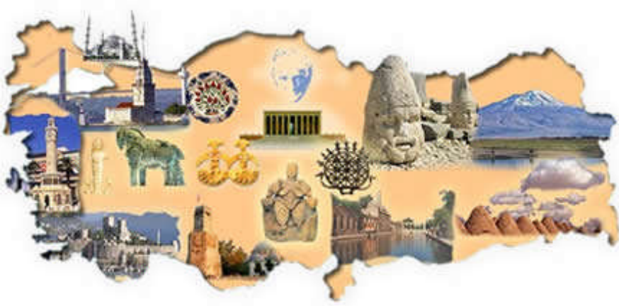
Resim 1.11: Farklı kültürlerin simgeleri

Kültür; dil, inanç, değer, norm davranışlar ile bir nesilden bir nesile maddi ve manevi öğelerden oluşan bir bütün olarak açıklanabilir.