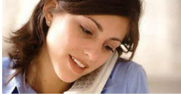
Resim 1.7: Telefonla konuşmada ses tonu önemlidir

Telefonla konuşmak belli bir kültürü ve beceriyi gerektirir. Toplumda dikkat edilmesi gerekli kurallardan birisi de telefon konuşmalarıdır. Önemli bir iletişim aracı olan telefon, giderek amacının dışında da kullanılmaya başlamıştır.