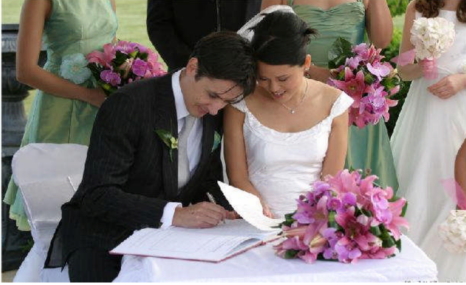
Resim 1.10: Düğün törenleri göreneklere örnek verilebilir.