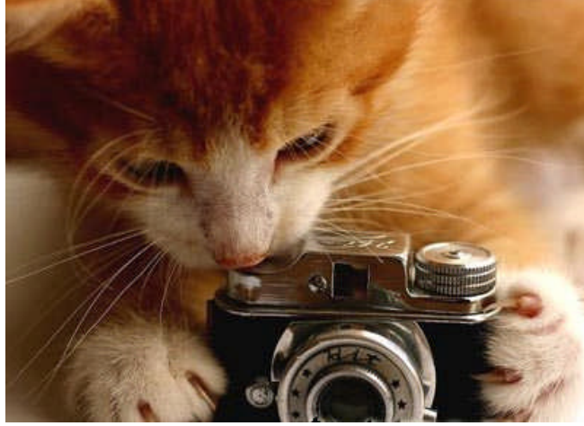
Resim 1.8: Medya ahlakı topluma karşı bir sorumluluktur

Medya ahlakı ise, medya kuruluşlarının, haber, ilan, reklâm ve satış promosyonlarının dürüst, gerçeğe dayalı, topluma karşı bir sorumluluk duygusunu taşıyacak biçimde olmasını gerektirir.