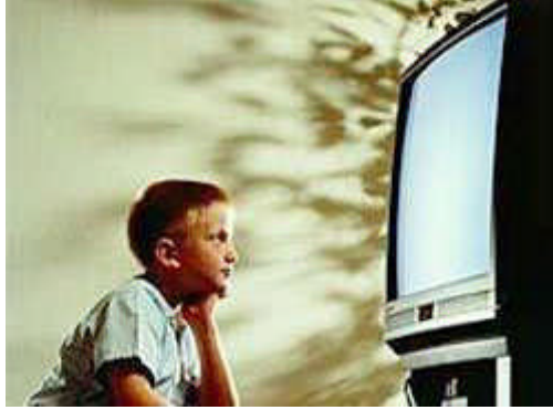
Resim 2.15: Kitle iletişim araçlarının çocuklara olumsuz etkilerine karşı dikkatli olunmalıdır.

Görölüyor ki, kitle iletişim araçlarından biri olan televizyon bireylerin sosyalleřmesini olumsuz yönde etkileyebilmektedir. Bu yüzden televizyon izlerken seçici olmalı, televizyona ayrılan süre, kendini geliřtirmek için ayrılmalı, bunun içinde kitap okunmalıdır. Program yapımıcılarda bireylerin sosyalleřmesini destekleyici programlar yapılmalıdır.