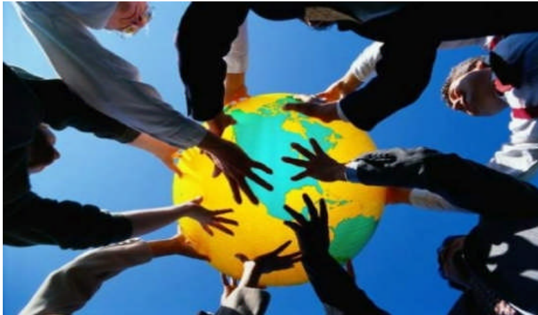
Resim 2.5: Ekip çalışmalarında herkes rol ve sorumluluklarını bilir.