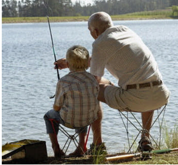
Resim 1.2: Ortak uğraşlar insan ilişkilerini güçlendirir.

İnsan ancak ilişkileri içinde var olabilen bir yaratık olduğundan, insanların düşünebilme, düşündüğünü karşısındakine anlatabilme yeteneği, toplumsal yaşamın temelini oluşturur. İnsanın düşünce ve duygu alışverişini kısıtlamak ya da genişletmek onun yaşam biçimini değiştirir.