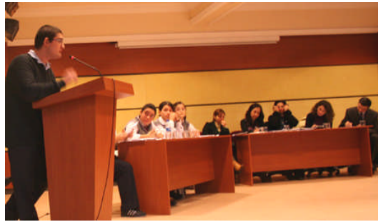
Resim 1.15: Münazara ortamına bir örnek