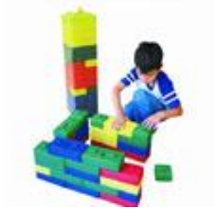
Resim 1.8: Plastik bloklar

Blok köşesinde ayrıca, boyut olarak daha küçük ve sert ahşaptan yapılmış değişik geometrik şekiller ve birbirini tamamlayıcı parçalardan oluşan bloklar bulunmalıdır. Çocukların bu bloklarla yaratıcı ürünler oluşturabilmeleri için parça sayısının fazla olmasına özen gösterilmelidir.