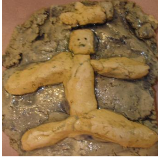
Resim 1.27: Kil hamuru ile çalışma

Toz halindeki kil su ile karıştırılarak ele yapışmayacak kıvamda hamur yapılır. Ele yapışmıyorsa sulu hazırlanmış demektir. Üç boyutlu çalışmalar için kil uygun bir malzemedir. Diğer yoğurma maddelerinden daha dayanıklıdır, kolay ve kalıcı şekil verilebilir. Hatta fırınlanıp daha uzun ömürlü saklanabilir. Kili uzun zaman saklamak için üzeri ıslak bezle örtülmelidir.