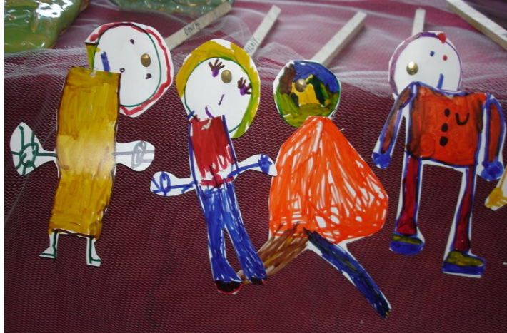
Resim 1.14: Çocukların yaptığı kuklalar

Kuklaların kukla sahnesinin yanında raflara yerleştirilmesi çocukların ilgisini çekmek açısından önemlidir. Zaman zaman kukla çeşitleri değiştirilerek köşe ilgi çekici hale getirilmelidir. Ayrıca bu köşede çocukların kendi yaptıkları kuklalar da sergilenmelidir.