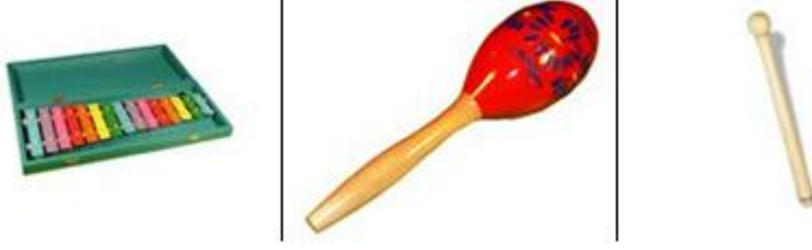
Resim 1.18: Müzik köşesi ritim araçları

Erken yaşlarda müziğin ve müzik eğitiminin pek çok yararı vardır. Bir sanat ve kültür ürünü olan müzik çocuklara büyük mutluluk verirken sosyal, duygusal doyum ve rahatlama sağlar. Müziğin ritmine uyularak yapılan çeşitli danslar küçük kas gelişimine, zihin dil gelişimine, kulak eğitime yardımcı olur. Aynı zamanda çocukta yaratıcılığın desteklenmesinde de büyük rolü vardır.