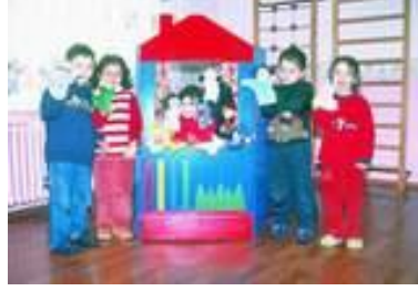
Resim 1.13: Çocuklar ve kuklalar

Okul öncesi eğitim kurumlarında mutlaka bir kukla köşesi bulundurulmalıdır. Bu köşede çeşitli kuklalar (el, parmak, yüzük, ip, çorap, gölge, çomak vb.), kukla oynatılacak sahne yer almalıdır. Alınan ya da hazırlanan kuklaların canlı renklerde, ilgi çekici ve dayanıklı olmasına dikkat edilmelidir. En önemlisi de kuklaların, çocukların rahatlıkla oynayabilecekleri büyüklükte olmasıdır. Köşede yer alan kuklalar sadece bu köşede kullanılmamalı; Türkçe dili etkinliklerinde, oyunda, müzikte dramatizasyonlarda da kullanılabilir.