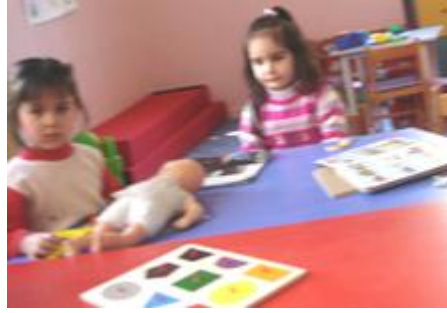
Resim 1.16: Eğitici oyuncak köşesi

Çocukların sayıları tanıma, sınıflandırma, gruplama, parçalardan bütün oluşturmalarını kolaylaştırır. Düşünme, karar verme, akılda tutma gibi zihinsel işlevleri de geliştirir. Eğitici oyuncaklarla oynanan oyunlar çocukların algılamasını, bir konuda belli bir süre dikkatini toplayabilmesini, problemlere deneme yanılma yoluyla çözümler bulmasını sağlamaktadır. Gözlem yapmalarını kolaylaştırır. Araştırma, karşılaştırma, ilişki kurma, benzerlerini ya da farklılıklarını bulma gibi görsel yeteneklerini geliştirmelerine yardımcı olur.