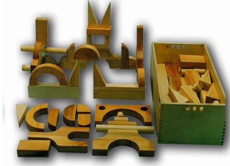
Resim 1.7: Çeşitli büyüklükteki tahta bloklar

Blok köşesinde bulundurulacak bloklar çeşitli büyüklüklerde olmalıdır. Bunlar bir araya geldiğinde bir bütün oluşturabilmelidir. Tahtadan yapılmış çeşitli büyüklüklerde bloklar, içi boş kutular, tahta kaşıklar, oyuncaklar, hayvanlar, trafik işaret takımları bu köşede bulundurulabilecek oyuncaklardır.