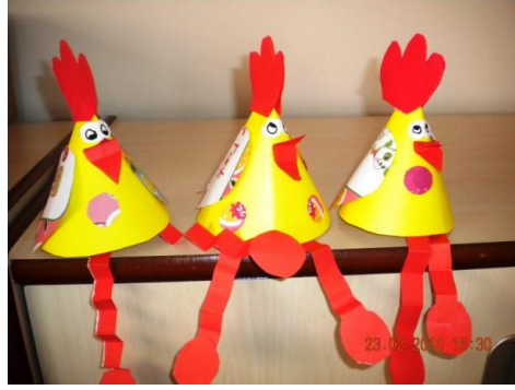
Resim 1.34: Kâğıt işi teknikleri

Kâğıt üzerine çizilen herhangi bir şeklin makas yardımıyla kesilip çıkarılmasına kâğıt kesme denir. Çocuğa önce makas tutma ve düz çizgi üzerinden kesme çalışmaları yaptırılır. Önce basit şekiller daha sonra ayrıntılı şekiller kestirilir. En çok kullanılan tekniklerdendir. Çocuklara yapıştırma resim için hazırlanan geometrik şekiller verilerek resim yapması istenebilir. Çocuklar bu şekilleri yan yana yapıştırarak çeşitli şekiller oluşturabilir.