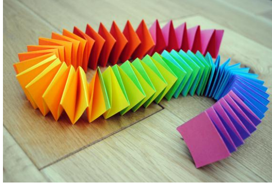
Resim 1.35: Kâğıt işi süsleme

Delgi zımba veya çeşitli araçlar kullanılarak (ucu sivri olmayan) kâğıtlar üzerinde delikler açma ise kâğıt delme tekniğidir.