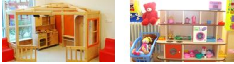
Resim 1.6: Evcilik köşesi

Çünkü çocuklar bu köşelerde oynamaktan büyük zevk alırlar. Aldıkları çeşitli rollerle hayal güçlerini de kullanarak değişik oyunlar oynarlar. Bazen anne, baba, çocuk, doktor, hemşire, öğretmen, postacı gibi çeşitli kimliklerle gelecekte üstlenecekleri rollere hazırlanırlar. Çocuk bu köşede kendi kendine ya da arkadaşları ile oynarken hayal gücünü geliştirir. Paylaşmayı, yardımlaşmayı ve kurallara uyma gibi pek çok sosyal davranışı kazanır.