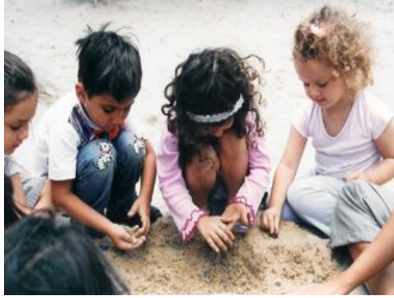
Resim 1.1: Serbest zaman etkinlikleri

Serbest zaman diliminde çocuklar yetişkin yönlendirmesi olmadan kendi ilgileri doğrultusunda oynayacakları köşeleri ve oyun arkadaşlarını seçerler. Köşelerde oyun olarak da isimlendirilen serbest zaman etkinlikleri çocuk oyunlarından “yarı yapılandırılmış oyun” kategorisi için değerlendirilmektedir.