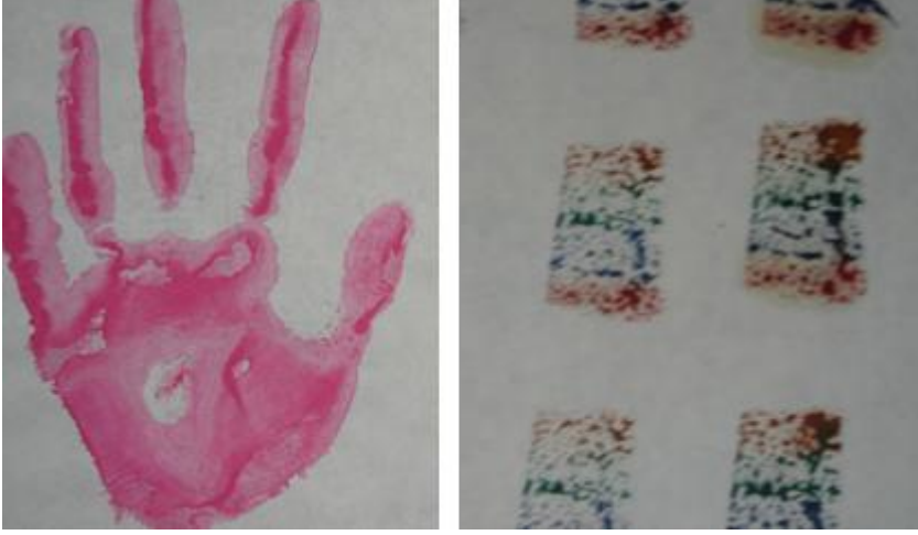
Resim 1.30: El ve sünger baskısı

Gazoz kapağı ve farklı özellikteki kapakların iç kısımları boyanır ve kâğıtlara değişik şekillerde bastırılarak resimler oluşturulur.