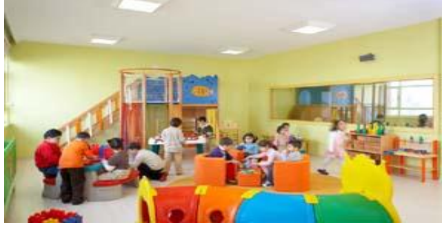
Resim 1.3: Serbest zamanda ilgi köşelerinde oyun

Öğretmen çocukların çalışmalarına değer vermeli ve bu çalışmalarını dosyalayarak uygun yerde saklamalıdır. Çocukların gelişim raporlarının yazılmasında diğer etkinliklerde olduğu gibi serbest zaman etkinlikleri sırasındaki gözlemleri de öğretmen açısından önemli bir yer tutmaktadır.