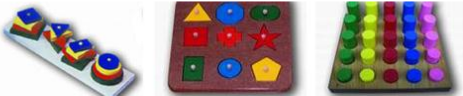
Resim 1.17: Eğitici oyuncak çeşitleri

Çocukların zihin gelişiminde büyük önemi olan bu oyuncaklarla çocuklar büyük, küçük, sayı, renk, şekil, miktar vb. pek çok kavramı da geliştirme imkânı bulurlar. Ayrıca eğitici oyuncak köşesi yaratıcılığı da destekler. Grupla oynanan eğitici oyuncaklar ise çocukların birbirleriyle iletişim kurmalarına iş birliği içinde bir oyunu sürdürebilmelerine fırsat verdiği için dil gelişimi ve sosyal gelişim açısından da önemlidir. Eğitici oyuncaklar el-göz koordinasyonunu ve küçük kas becerilerinin gelişimini desteklemektedir. Çocuklar eğitici oyuncaklarla oynarken oyuncağın amacına uygun belli yönergelere uyarak ve belli bir süre bir etkinliği sürdürebilmek gibi davranışları kazanırlar. Eğitici oyuncaklarla olaylar ve objeler arasında neden-sonuç, benzerlik, parça-bütün gibi ilişkiler kurarak veya onları belli bir özellik ya da oluş sırasına göre sıralayarak ve gruplayarak zihinsel yeteneklerini geliştirirler.