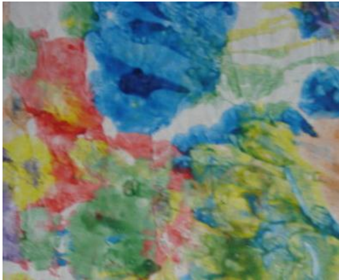
Resim 1.33: Parmak boyası

Su kaynamakta olan kabın içine bir kap konularak (benmari yöntemi) un, tuz ve soğuk su koyulaşmaya kadar pişirilir. Ateşten indirildikten sonra iyice çırpılır. İstenen renk boya ilave edilerek kullanılır.