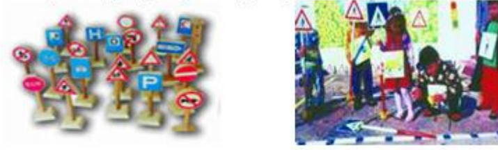
Resim 1.22: Geçici ilgi köşeleri

Trafikle ilgili hazırlanabilecek bir geçici köşede trafik lambaları, çeşitli trafik araçları, trafik işaretlerinden hazırlanan kartlar, bu işaretleri açıklayan resimli kartlar, trafik polisi kıyafetleri ilk yardım çantası gibi pek çok araç gereç kullanılabilir.