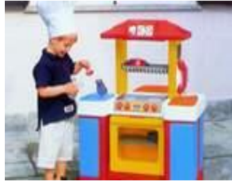
Resim 1.24: Geçici ilgi köşeleri

Her geçici köşenin özelliğine göre gerçek malzemeler konulabileceği gibi bazı malzemeler çocuklarla birlikte de yapılabilir. Böylece onlarda sorumluluk duygusunun gelişmesine güven duygusunun artmasına yardımcı olunabilir. Konuyla ilgili sohbet ederek köşeyi düzenlemek konunun pekişmesini sağlar.