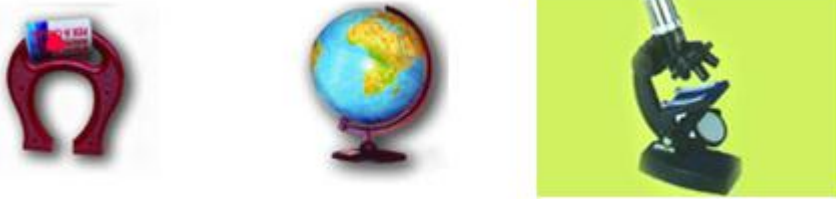
Resim 1.11: Fen ve matematik köşesindeki araçlar

Büyüteç, termometre, saat, levhalar, mıknatıslar, prizmalar, çeşitli bitki ve tohumlar, doğadan, alınmış taşlar, deniz kabukları, bitki tohumları ve çekirdekler, kumaşlar, tüyler, fosiller, yapraklar, dürbün, dünya küresi, hava grafiği, boy aynası, el feneri, resimler, koleksiyonlar, kurutulmuş bitki ve böcekler, büyüteç, çeşitli kitap ve ansiklopediler ise konuyu çocukların incelemesine olanak tanır. Tadabilecekleri, koklayabilecekleri, dokunabilecekleri, seslerini dinleyebilecekleri kısacası duymalarını geliştirecek değişik materyaller bulundurulmalıdır. Bu köşeye sayı şablonları, boncuklar, ölçme çubukları, sayı yapbozları, mıknatıslı rakamlar, abaküs, cetveller, saat, ip, rafya, metre, mandal, boncuk, renk skalaları gibi araçlar konulabilir. Bu araçlar çocukların basit matematik alıştırmaları yapmalarına fırsat verebilir. Hava grafiği, fen ve matematik köşesinde sürekli bulunmalı, çocuklar değişen hava olaylarını burada incelemelidir.