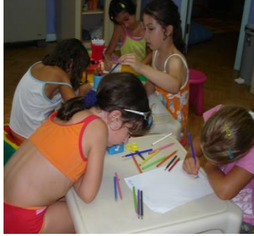
Resim 1.5: Sanat etkinlikleri

Sanat etkinlikleri, temelde yaratıcılığı ve estetik duyarlılığı geliştirmeyi hedefleyen etkinliklerdir. Bu çalışmalarda önemli olan nokta elde edilen sonuç değil kullanılan yöntemlerdir. Bu nedenle çocuklara yeterli zaman, rahat çalışabilecekleri genişlikte bir yer, yaş, gelişim düzeyi ve bireysel ayrıcalıklarına uygun araç gereçler verilmeli, böylece yaratıcılığını daha iyi ortaya koymasına sağlanmalıdır.