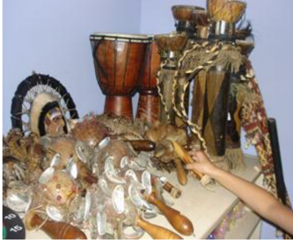
Resim 1.19: Müzik köşesi ritim araçları

Erken yaşlarda müziğin ve müzik eğitiminin pek çok yararı vardır. Bir sanat ve kültür ürünü olan müzik çocuklara büyük mutluluk verirken sosyal, duygusal doyum ve rahatlama sağlar. Müziğin ritmine uyularak yapılan çeşitli danslar küçük kas gelişimine, zihin dil gelişimine, kulak eğitime yardımcı olur. Aynı zamanda çocukta yaratıcılığın desteklenmesinde de büyük rolü vardır.