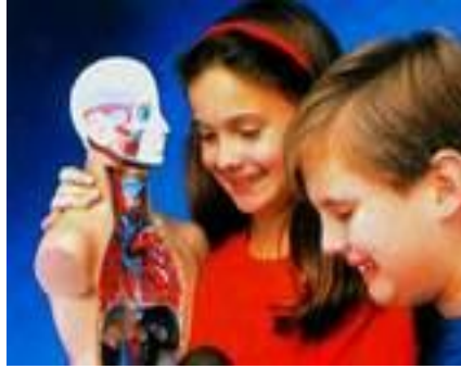
Resim 1.10: Fen ve matematik çalışmaları

Çocukları gözlem yapmaya, araştırma, inceleme ve keşfetmeye yönelten etkinliklerdir.