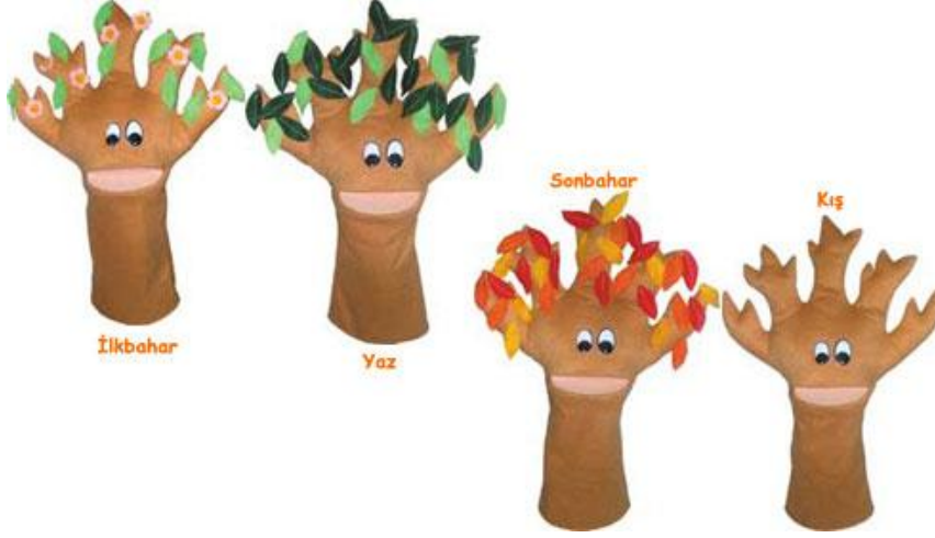
Resim 1.15: Mevsimlerle ilgili kuklalar

Çocuklar, öğretmenlerine ve arkadaşlarına kukla gösterisi yapmaktan büyük zevk duyarlar. Öğretmen bu imkânı çocuklara tanınmalı ve teşvik edici sözlerle çocukların kendine güven duymasını sağlamalıdır.