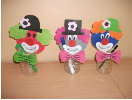
Resim 1.37: Artık malzemelerle çalışmalar