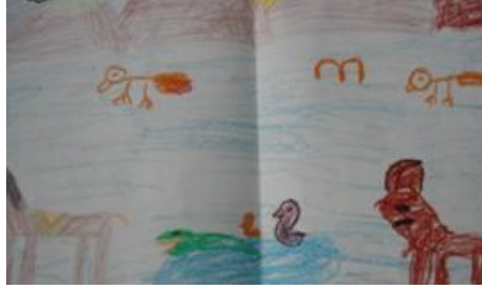
Resim 1.28: Pastel boya ile serbest resim