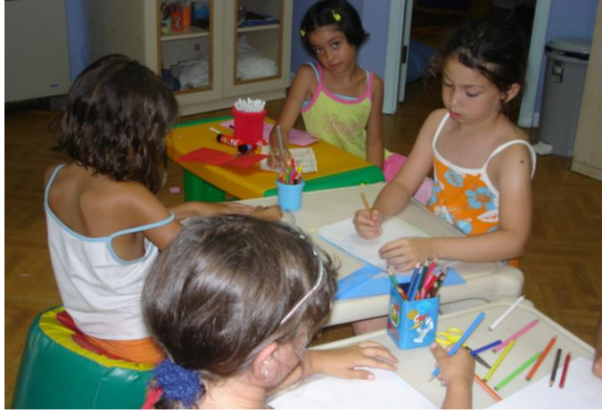
Resim 1.2: Serbest zaman etkinlikleri

Öğretmen bu etkinliklerde çocukların bireysel ayrıcalıklarına, ilgi ve ihtiyaçlarına yönelik çok sayıda seçeneği aynı anda sunmalıdır. Çocuklar istekleri doğrultusunda, hangi çalışmaya katılacaklarına karar vermelidir.