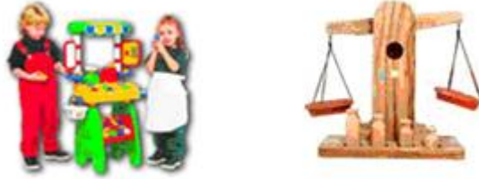
Resim 1.23: Meslekler konusu ile ilgili manav köşesi

Bir manav köşesi düzenlenebilir. Kasalar yapıp içine yoğurma maddelerinden meyveler sebzeler çocuklarla birlikte yapıp konulabilir. Terazı, manav önlüğü, kollukları, şapkası, küçük kese kâğıtları, tezgâh olarak kullanılacak kutular, fiyat etiketleri gibi araç gereçler hazırlanıp bir geçici köşe de hazırlamak mümkündür.