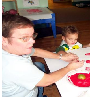
Resim 1.25: Sanat alıřması

Günlük eđitim programında, serbest zaman etkinlikleri içerisinde özelliklerine göre farklı teknikler gerektiren sanat etkinliklerine, ele alınan amaç ve kazanımlar doğrutusunda yer verilmelidir.