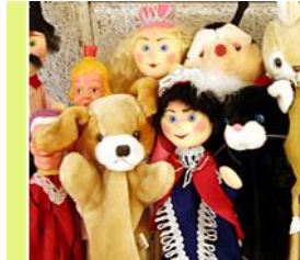
Resim 1.12: Kuklalar

Çocukların her zaman severek oynadıkları ve oynamaktan büyük zevk aldıkları oyuncaklardan biri de kukladır. Çocuklar kuklalarla oynarken hayal güçlerini kullanırlar. Yaratıcılıklarını geliştirirler. Bazen kuklaları kendi yarattıkları bir öykünün kahramanı yapıp oynatırlar. Bazen da kuklalarla kendi yaşamlarını canlandırırırlar. Böylece kuklalar zihin ve dil gelişimine yardımcı olurken çocuğun duygularının açığa çıkmasına da yardımcı olurlar. Beraber oynanan oyunlar esnasında çocukta arkadaşları ile bir olayı paylaşma, kurallara uyma, başkalarını dinleme gibi sosyal yönlerinin gelişmesi de mümkün olmaktadır.