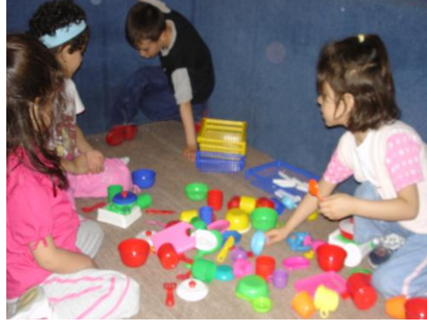
Resim 1.4: İlgi köşesi oyunu

yallerini yansıtarak kendilerini ifade ederler. Çevresindeki kişilerle özdeşim kurarak onları taklit ederler.