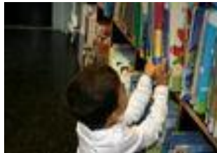
Resim 1.9: Kitap köşesi

İnsanların en iyi dostu olan kitaplar henüz okuma yazma bilmeyen çocuklar için de iyi bir arkadaştır. Okuyamaları bile sayfalarını karıştırmak resimlerine bakmak, çocuklar için büyük bir zevktir. Çocukları kitaba alıştırmak ve sevdirmek için okul öncesi eğitim kurumlarında kitap köşesi bulunmalıdır.