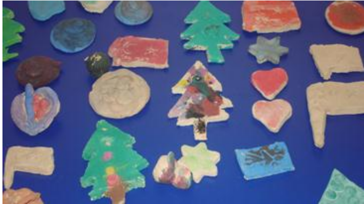
Resim 1.26: Yođurma maddesi (kil) çalıřma örnekleri

Yaratıcılık, duygusal doyum el ve parmak kaslarının gelişmesini sađlayan, hayal gücünü geliřtiren çocuđun eline alıp řekillendirdiđi maddelere yođurma maddeleri denir. Okul öncesi eđitim kurumlarına en ucuz ve en kolay yoldan sađlanan malzeme, yođurma maddeleridir. Okul öncesi eđitim kurumlarının vazgeçilmez malzemelerindedir. Okulun ilk günlerinde çocuđa tuz seramiđi verilebilir. Çünkü çocuk yumuřak materyallerle oynamaktan, yođurmaktan ve deđişik řekiller yapmaktan çok hořlanır. Çocuk gelişip beceri kazandıķça tuz seramiđi yerini diđer yođurma maddelerine bırakmalıdır. Yođurma maddeleri, çocuklara üç boyutla çalıřabilme imkânı veren malzemelerdir. Çocuklara verilecek yođurma maddeleri renklendirilebilir ya da olduđu gibi verilir.