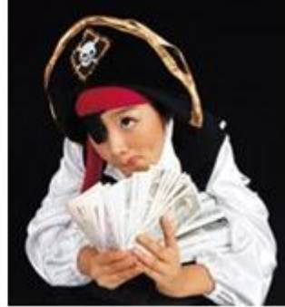
Resim 1.21: Kostüm ve aksesuar köşesinde bulundurulabilecek kıyafetler

Kostümler çocukların boyuna uygun yükseklikte ön tarafı tamamen açık (kapaksız) bir gardırop, kıyafetlerinin asılıp yerleşmesi ve düzenli görünmesi açısından düşünülmelidir. Dolabın alt tarafında ayakkabı, terlik ve maskeler, kemerler, kolyelerin yerleştirileceği birkaç tane raf olması gerekmektedir. Köşenin bir yerine çocukların kendisini görmesi için bir boy aynasının yerleştirilmesi uygun olur. Büyük boy kartonlardan yapılan ağaçlar, ev resimleri vb. dekorlar köşeyi daha eğlenceli hale getirir.