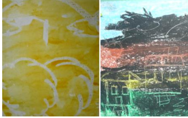
Resim 1.31: Sihirli boya, kazıma resim