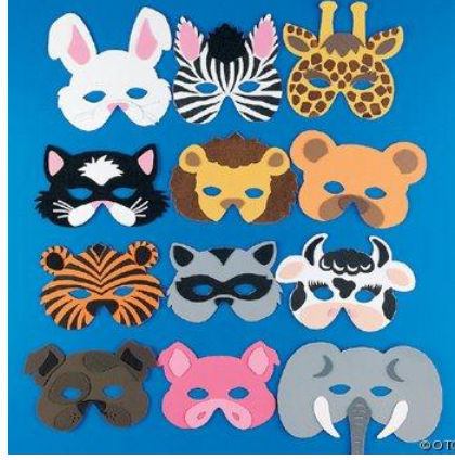
Resim 1.36: Kâğıt işi maskeler

Şapka ve çanta yapımı için karton, gazete kâğıdı vs. kullanılır. Güneşten korunmak için gazete kâğıdından basit şapkalar yapılır. Mukavva ve kartondan yapılan süslü şapkalar, özel günlerin kutlanmasında kullanıldığı gibi drama etkinliklerinde de kullanılabilir. Şapka ve çantalar kedi merdivenleri, ince uzun şeritler ve yaldızlı kâğıtlarla süslenebilir.