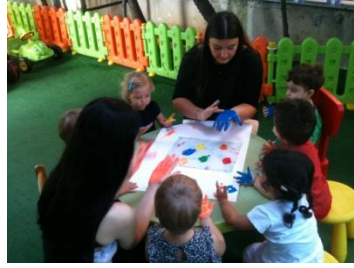
Resim 2.2: Boya çalışmaları

Erken çocukluk eğitiminde boya çalışmalarına, serbest zaman etkinlikleri içinde yer verilebileceği gibi ele alınan amaç ve kazanımlar doğrultusunda farklı bir etkinlik veya diğer birkaç etkinliğin tamamlayıcısı olarak da verilebilir. Boya masası hazırlanır. Boyalar, fırçalar ve kâğıtlar, resim yapılacak masanın üzerine bırakılır.