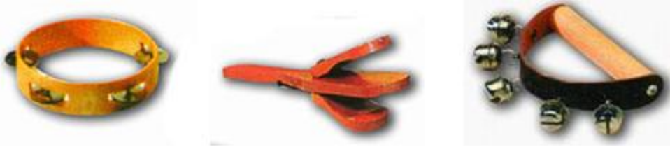
Resim 1.20: Müzik köşesinde bulunan araçlar

Ritim aletlerinin yanı sıra keman, mandolin, trampet, mızık, metalofon, ksilefon gibi çalgılar da bulunabilir. Bir müzik köşesinde bütün çalgıları bulundurmamak mümkün değildir. Bunların bir kısmı zaman zaman bu aleti çalan kişi tarafından tanıtılırsa çocuklar için daha ilgi çekici olabilir.