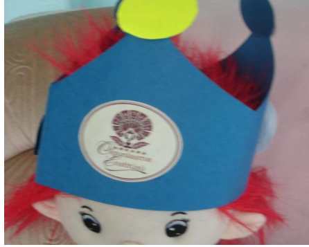
Resim 2.1: Kağıt işi başlık

Farklı özelliklerde renksiz kâğıtlar koyulur. Bunların bir kısmı değişik şekillerde (belli bir şekil belirtilmeyip ikiye, dörde katlanmış, uçları birleştirilmiş vb.) katlanarak konulur. Yanına kurşun kalem, tükenmez kalem, keçeli kalemler, boya kalemleri, silgiler, kalem açacakları ilave edilir. Ayrıca kartondan ya da mukavvadan hazırlanmış değişik figürler konulur. Çocuklar figürlerin dış hatlarını çizgilerle birleştirerek kalıplar çıkarır ve kompozisyonlar oluşturabilir.